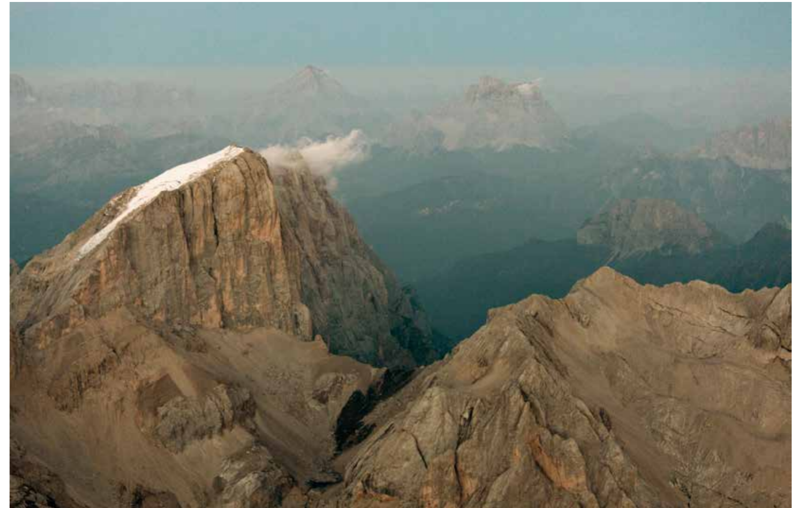
The southwest face of the Marmolada

"I HAVE EXPLORED AND PHOTOGRAPHED THESE MOUNTAINS FAR AND WIDE: LATEMAR, THE HIGHEST PASTURE IN EUROPE; MOUNT CIVETTA, ONE OF THE MOST SOUGHT-AFTER PEAK BY MOUNTAINEERS WORLDWIDE; MARMOLADA, THE HIGHEST OF THE DOLOMITES WITH ITS GLACIER WHICH IS A TOURIST ATTRACTION FOR SUMMER SKIING; MISURINA LAKE, SURROUNDED BY THE SUPERB TRE CIME DI LAVAREDO; THE "PALE MOUNTS"...SOME OF THE SHOOTING HAS BEEN TAKEN FROM THE HELICOPTER, BUT YOU CAN GET EQUALLY FASCINATING PICTURES BY REACHING THE REFUGES; THERE ARE HIKING TRAILS THAT ARE NOT SO DIFFICULT AND ON SOME STRETCHES YOU CAN EVEN DRIVE".