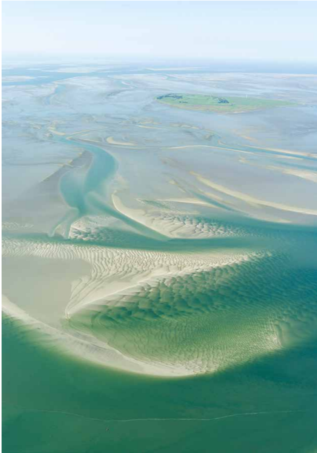
Neuwerk, Wadden Sea National Park in Schleswig-Holstein