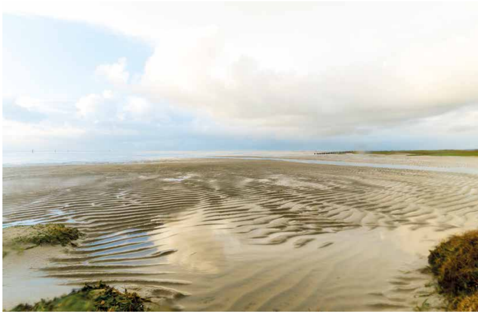
Low tide, sand, sun and rain

Le Dolomiti sono un monumento d'arte diffuso che l'UNESCO ha riconosciuto come Patrimonio dell'Umanità per la loro straordinaria bellezza e importanza scientifica per la storia della Terra. A mostrarci la maestosa bellezza di queste vette, sono le spettacolari fotografie di Georg Tappeiner, fotografo National Geographic originario di Merano, che da sempre esplora questo peculiare paesaggio percorrendolo a piedi o sorvolandolo dall'alto, e creando con la sua Hasselblad immagini creative e artistiche. Georg Tappeiner è ambasciatore di un messaggio rivolto a tutti noi: preserviamo le Dolomiti, che come le definisce l'alpinista Reinhold Messner sono le "montagne più belle del mondo". Alla fine di una lunga e complessa istruttoria, il World Heritage Committee dell'UNESCO ha dichiarato le Dolomiti Patrimonio dell'Umanità il 26 giugno del 2009.