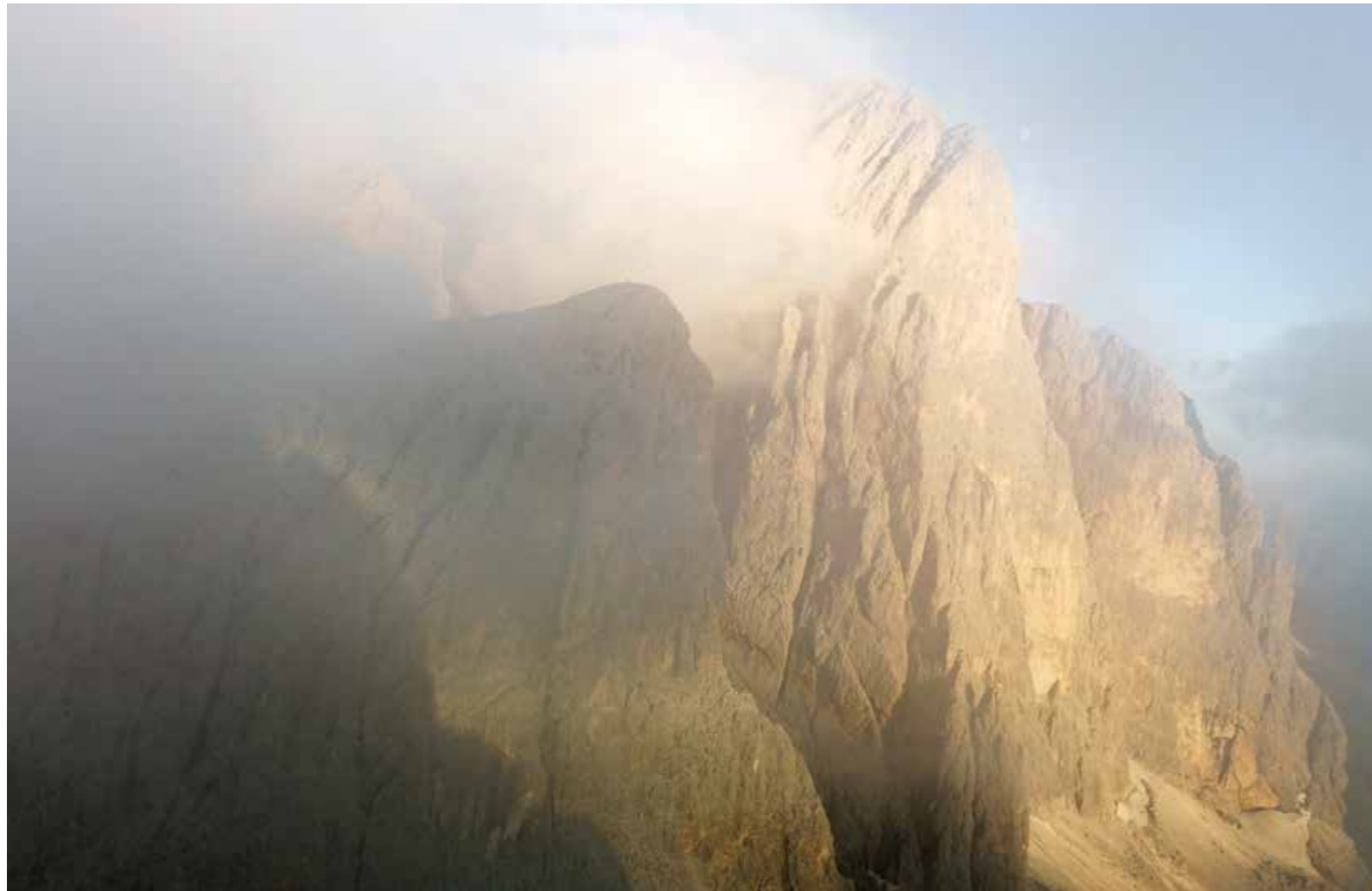
The Pala di San Martino