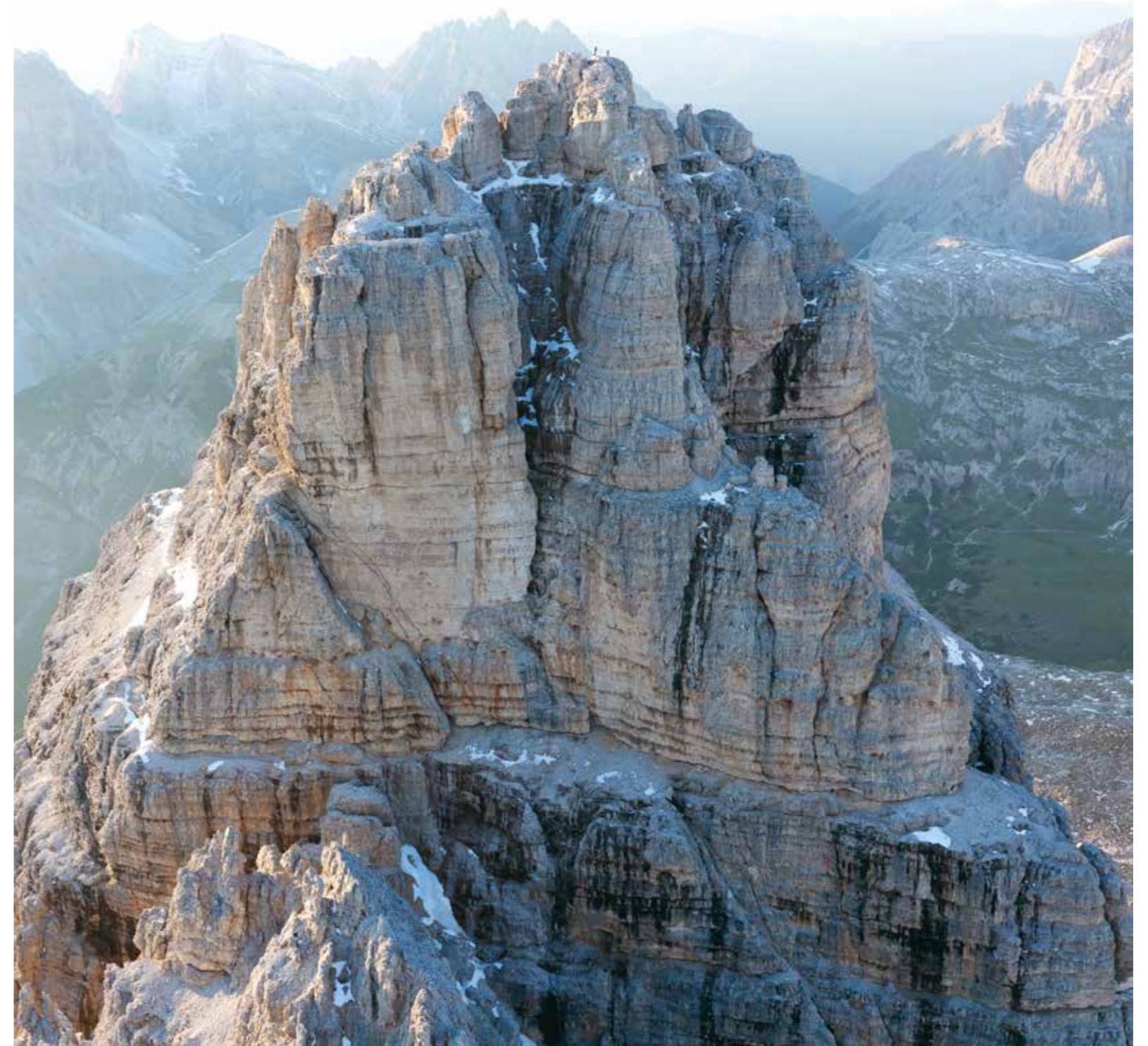
Previous page: Schlern with Vajolet and Rosengarten

Not very much...just a sleeping bag. I use Canon Eos 1 Ds Mk II with lenses ranging from 40 to 70mm; in some cases I employ a 12mm. Hasselblad plays an important part, though: quite a number of images included in the Dolomites project were shot with a H3DII-50, but I have recently switched to a H4D-50.